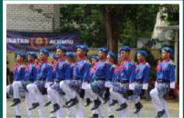
Pengibar Bendera Al-Ishlah