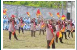
Gerakan Pramuka Al-Ishlah