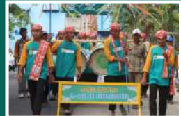
Jedor Santri Al-Ishlah