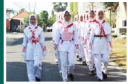
Lomba Gerak Jalan antar kelas